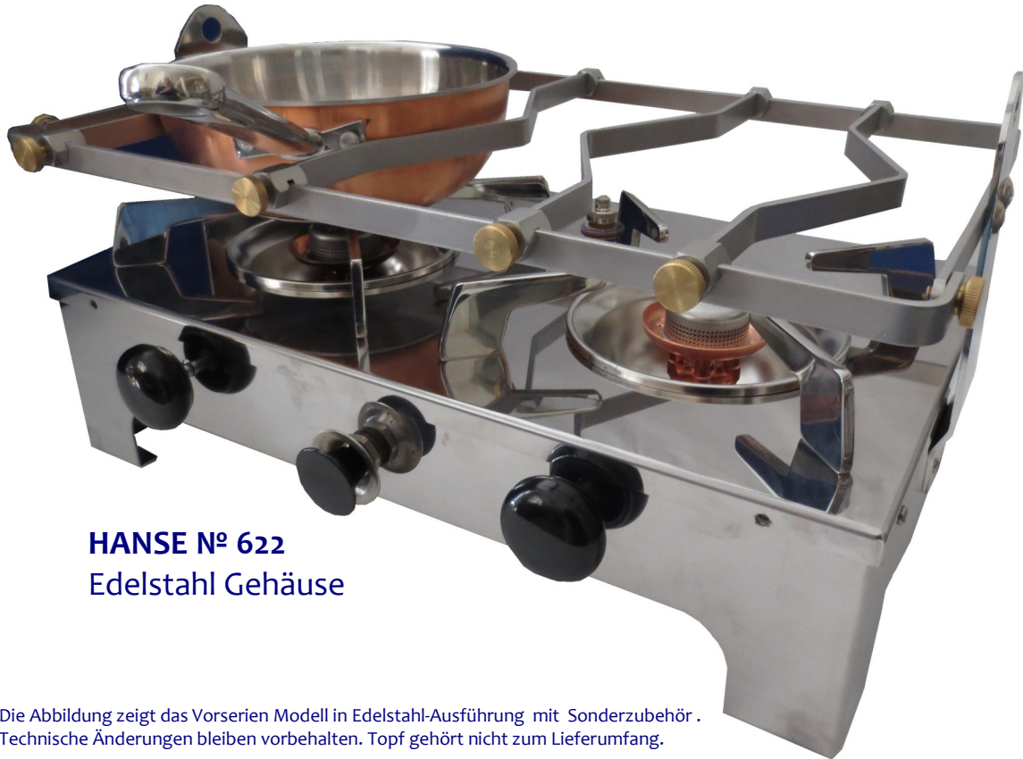
HANSE Nº 622 Edelstahl Gehäuse

Die Abbildung zeigt das Vorserien Modell in Edelstahl-Ausführung mit Sonderzubehör. Technische Änderungen bleiben vorbehalten. Topf gehört nicht zum Lieferumfang.